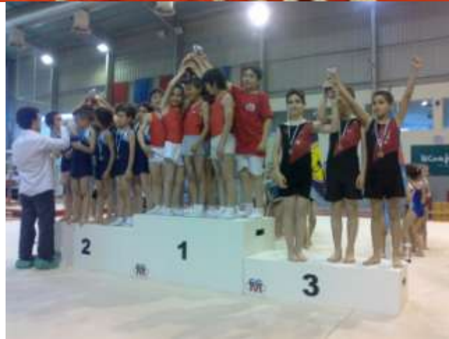
3° Lugar Equipa Masculina