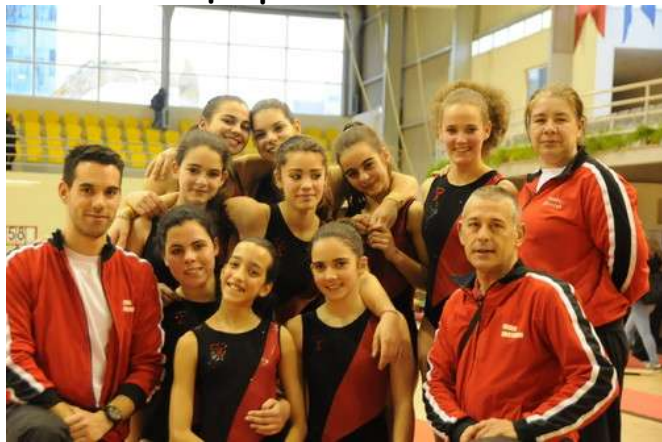
Ginastas Juvenis, Júnior e Sénior