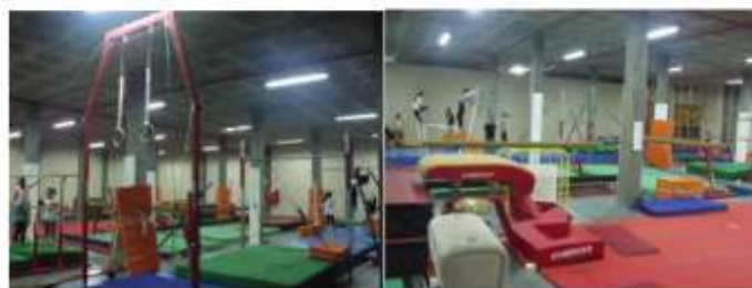
Ginásio do ClubeHPA