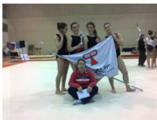
2° Lugar de Equipas