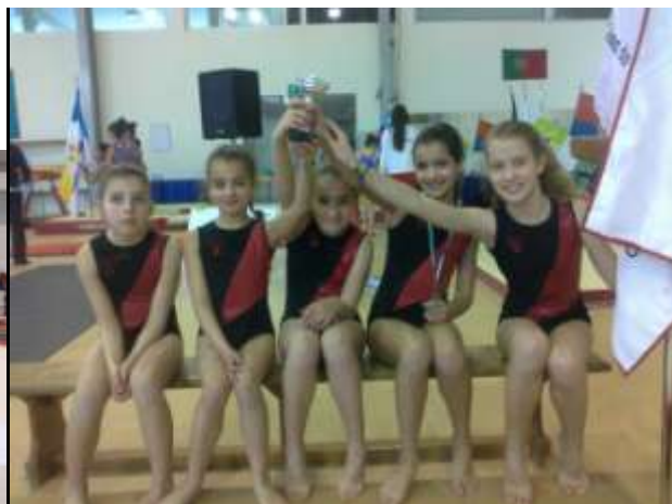
3º Lugar Equipas