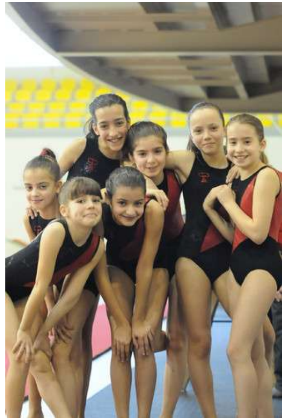
Equipa de Iniciadas e Juvenis